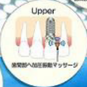
歯肉部へ加圧振動マッサージ