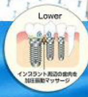
インプラント周辺の歯肉を 加圧振動マッサージ